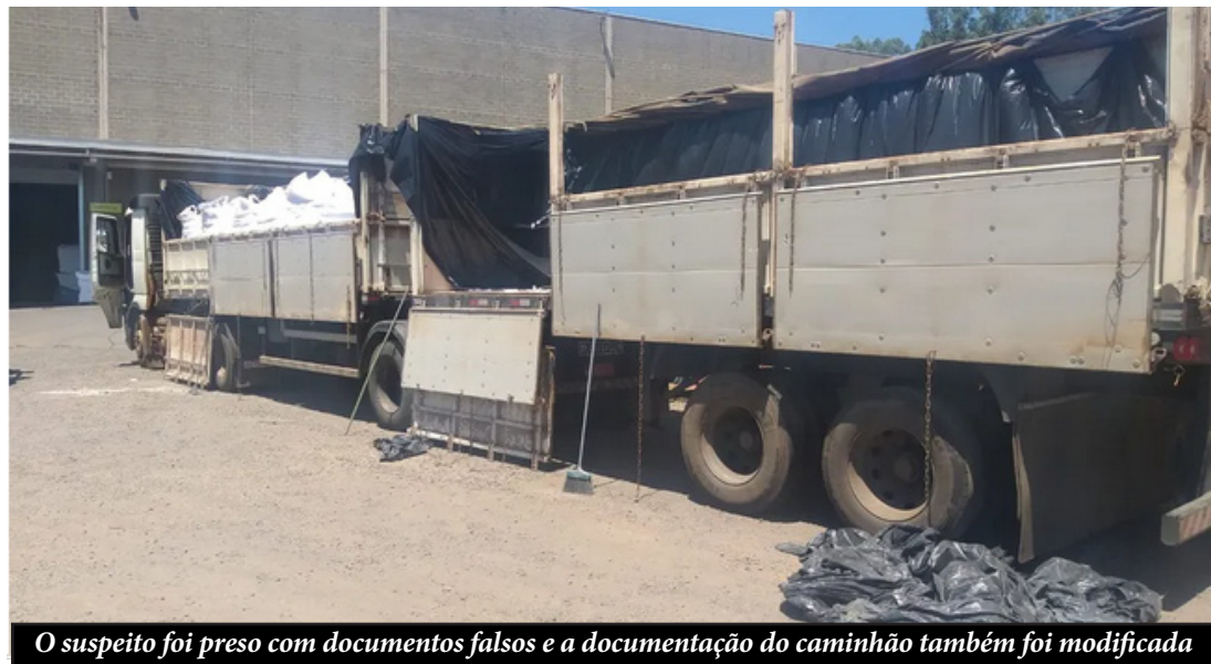
O suspeito foi preso com documentos falsos e a documentação do caminhão também foi modificada

Um homem de 30 anos, morador de Tocantins, foi preso ao ser flagrado tentando aplicar um golpe de desvio de carga em uma empresa cerealista em Santa Cruz do Rio Pardo, na quarta-feira (26). Outra empresa foi alvo do mesmo golpe no dia 20 do mesmo mês.