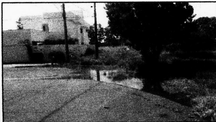
Imagem retratada no dia 29/12/2018